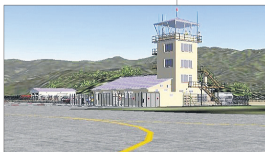
La recreación del aeródromo de La Seu (izquierda).