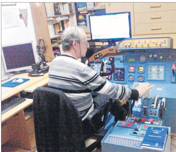
El autor, en una cabina para simulación que construyó él mismo.

La empresa Mach Helicòpters ofrecerá viajes en helicóptero desde el aeropuerto de Alguaire a Vielha a los esquiadores británicos y rusos que llegarán a Lleida a través de vuelos de touroperadores la próxima temporada de invierno. Así lo explicaron fuentes de la compañía, que indicaron que harán vuelos turísticos sobre Lleida y viajes a las bodegas del Castell del Remei.