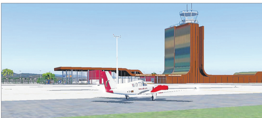
Aterrizaje de un avión en la pista del aeropuerto virtual de Alguaire.