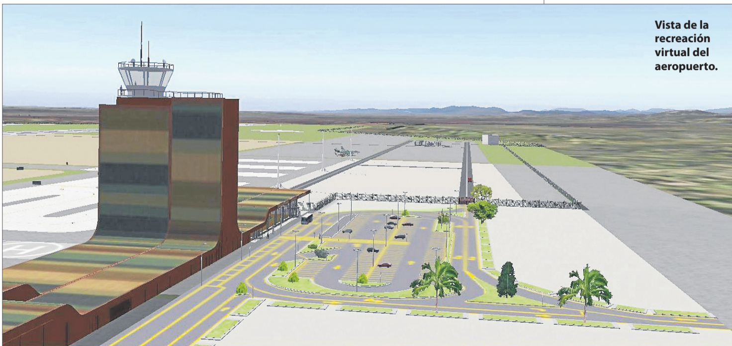
Vista de la recreación virtual del aeropuerto.